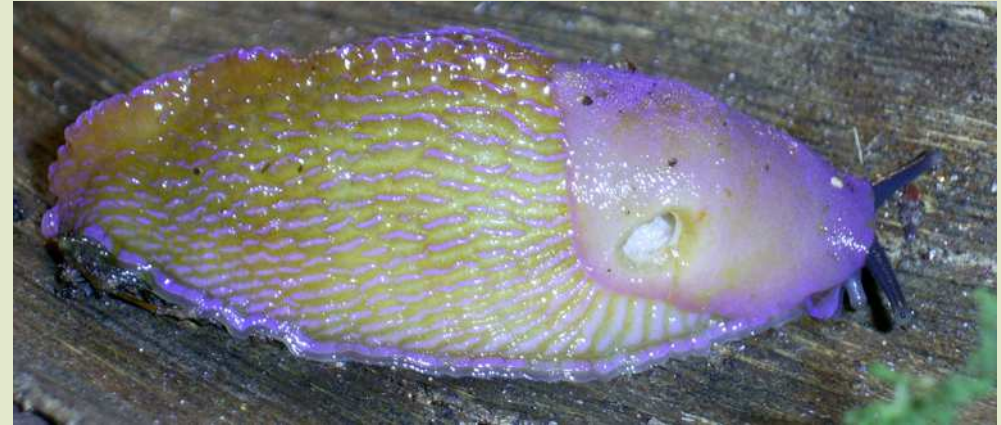
Після скорочення тіла.