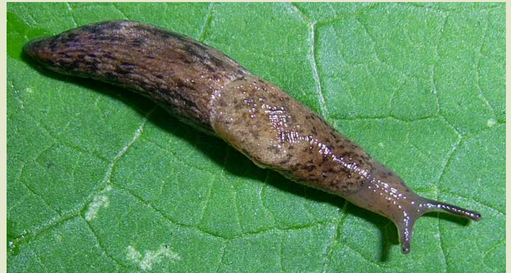
Слизняк польовий сітчастий.