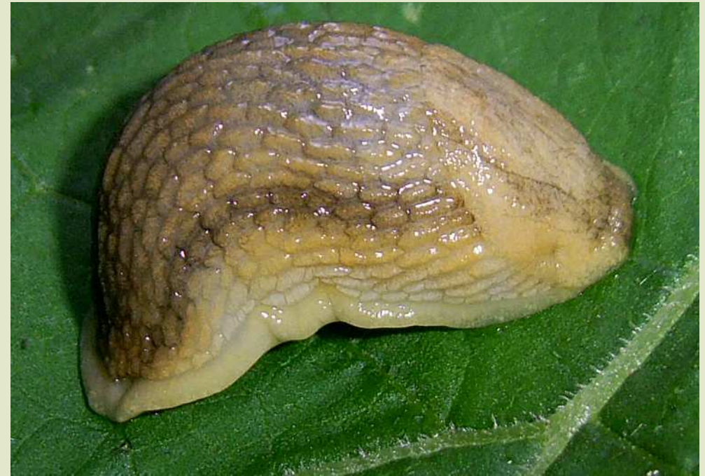
Слизняк шляховий блідий ( Arion fasciatus ).