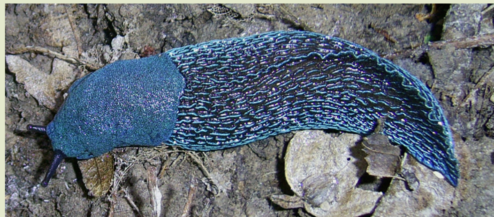
Слизняк великий синій.