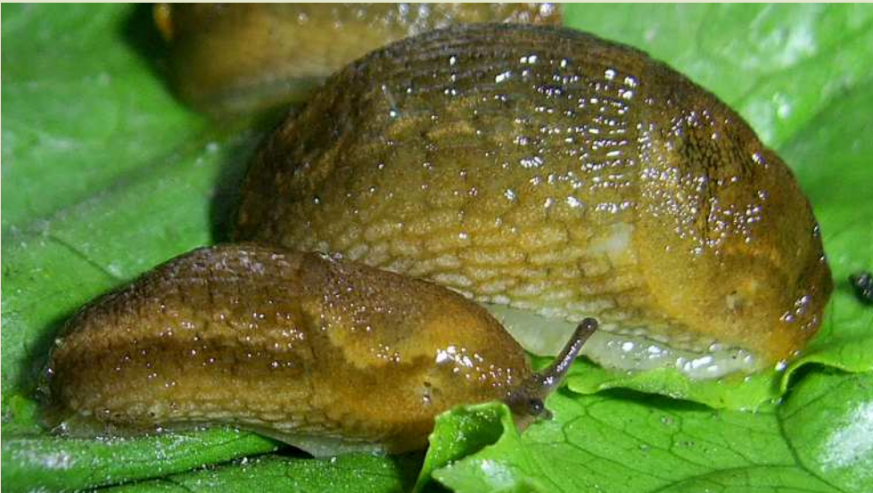
Слизняки шляхові руді ( Arion subfuscus ).

Інші шляхові слизняки, розповсюджені на території України, мають помітно менші розміри. Часто по боках їх тіла проходять добре помітні темні смуги. В іспанських слизняків бокові смуги можна побачити лише в молодих особин.