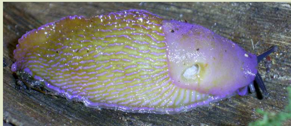
После сокращения тела.