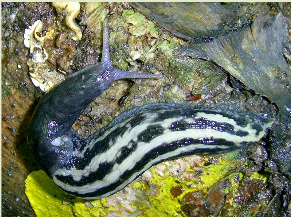
Слизень большой черный.