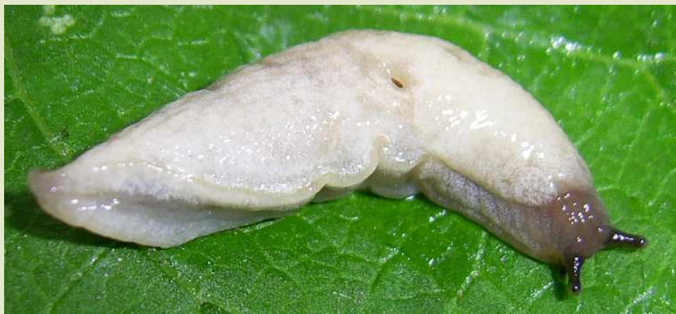
Слизень полевой румынский.

Один из широко распространенных на территории Украины видов, который часто встречается рядом с человеком – слизень полевой сетчатый ( Deroceras reticulatum ).