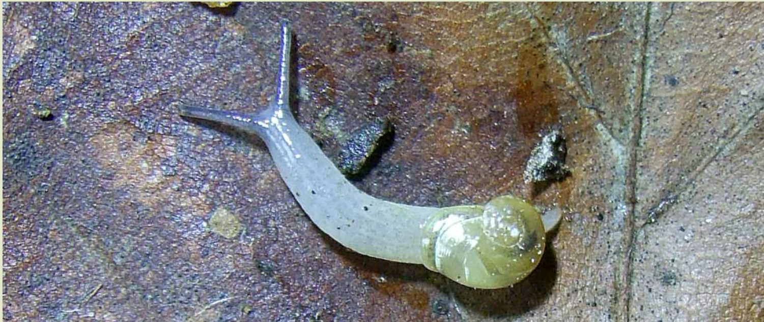
Фото 3. Полуслизень – даудебардия рыжая ( Daudebardia rufa ).

Между двумя большими группами наземных моллюсков (улитками и слизнями) есть небольшая промежуточная группа – полуслизни. Они сохраняют небольшую внешнюю раковину, но уже не могут спрятать в нее свое тело.