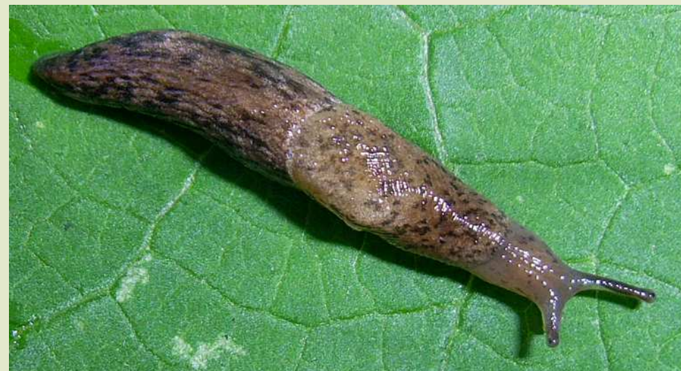
Слизень полевой сетчатый.