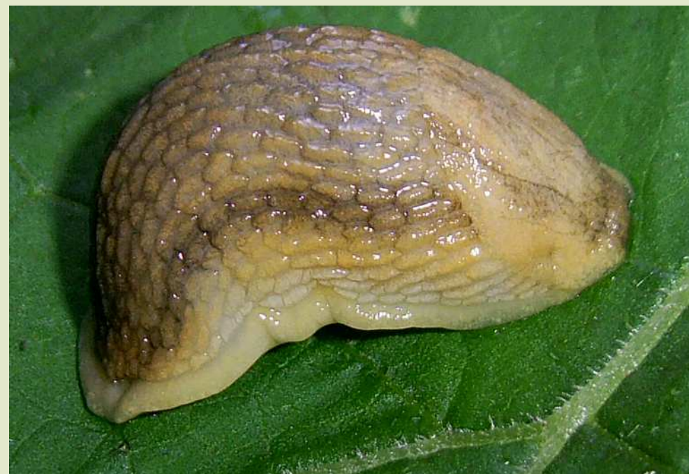
Слизень дорожный бледный ( Arion fasciatus ).